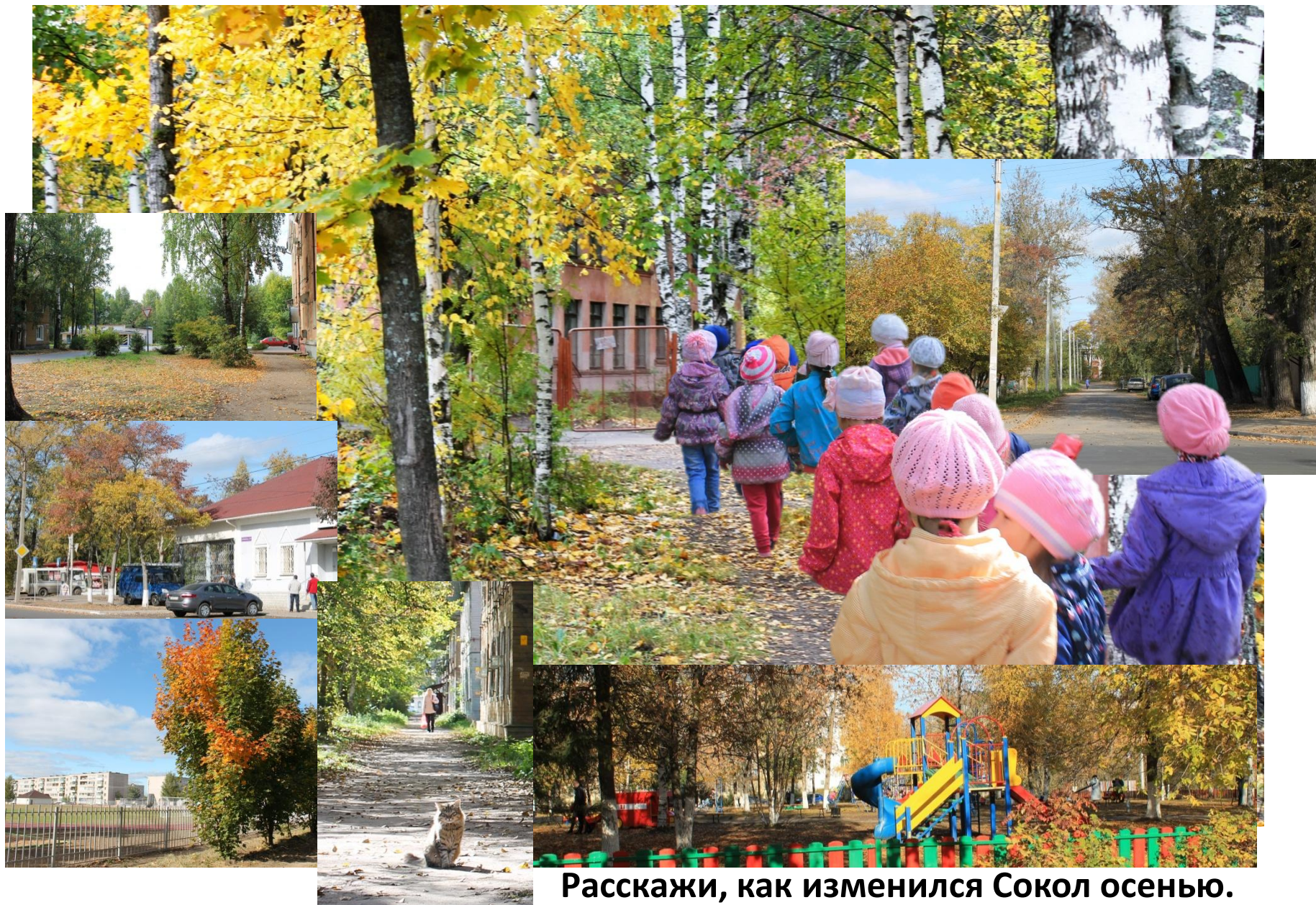
Расскажи, как изменился Сокол осенью.